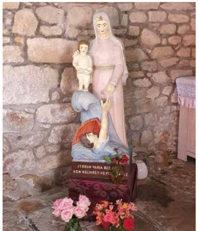
Rette mich!; Bretagne