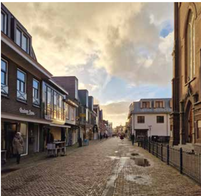
Egnond aan Zee; Niederlande