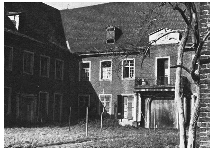
Innenhof um 1960