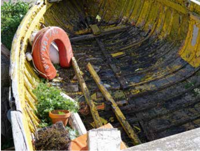
Doch noch Rettung; Bretagne

Zusehen waren 23 Motive von Reisen im benachbarten Ausland und von Exkursionen in der näheren Umgebung.