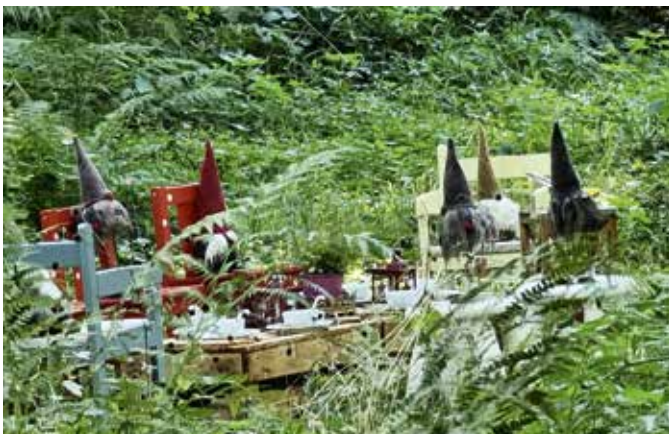
Rat der Weisen; Jüchen